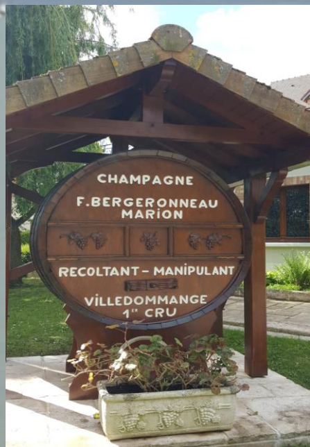
Cave de Champagne

Information : 06-73-20-84-13 ou : contact@transportsetdecouvertes.com