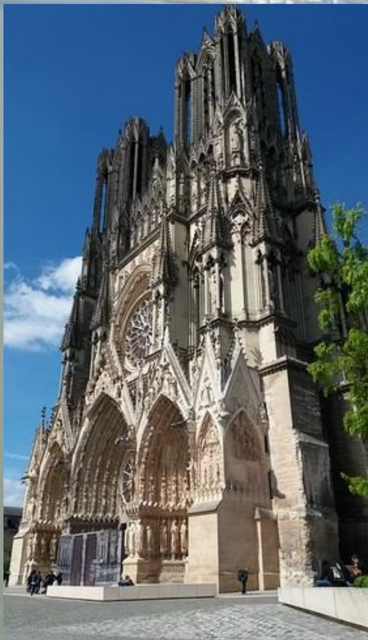
La Cathédrale de Reims